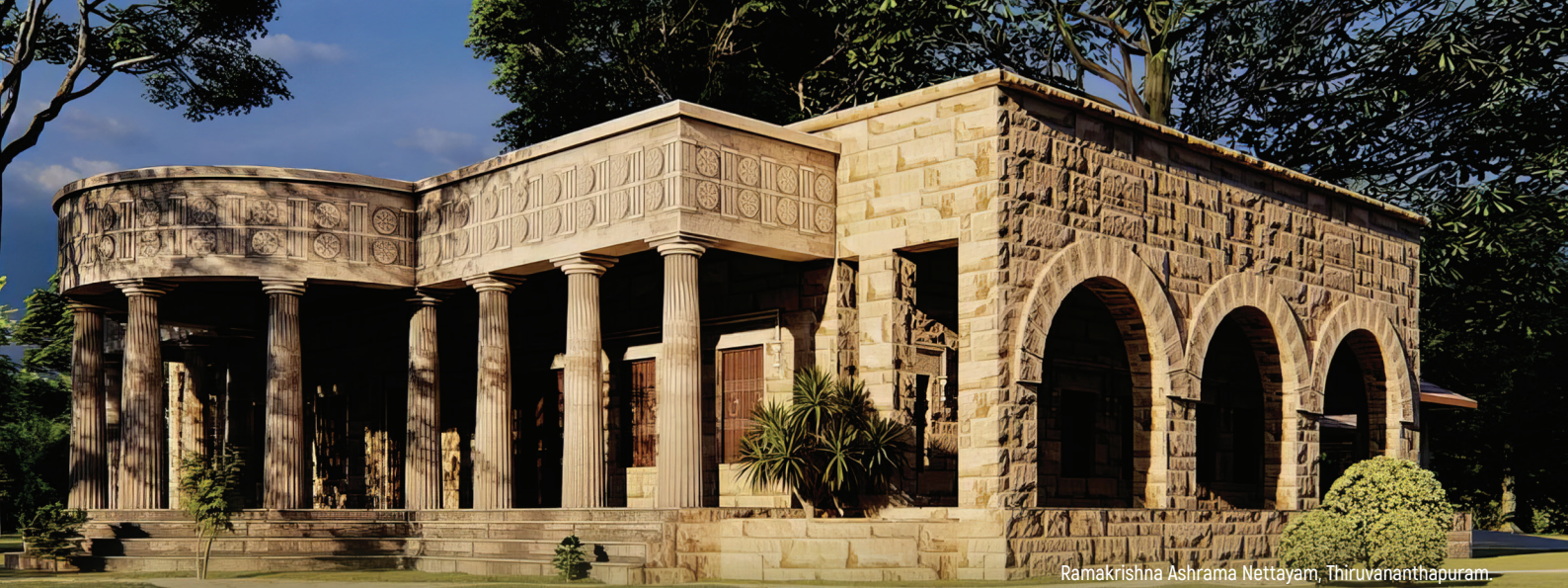
Ramakrishna Ashrama Nettayam, Thiruvananthapuram.