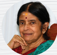
Padma Shri Aswathi Thirunal Gowri Lakshmi Bayi